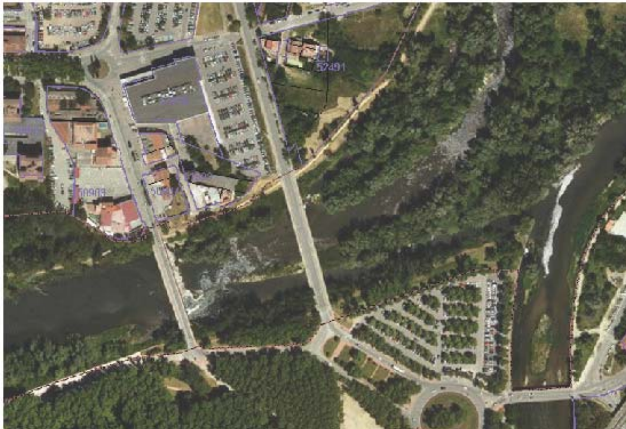
Dades cadastrals sobre imatge actualitzada – consulta del 9 04 2021